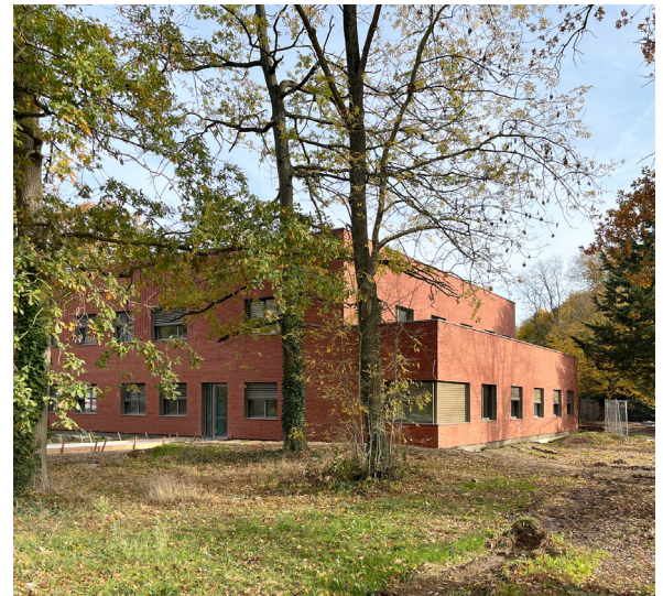
Construction d'un Accueil médico-technique (AMT) sur le site de l'Établissement Public de Santé Ville Evrard à Neuilly-sur-Marne (93)